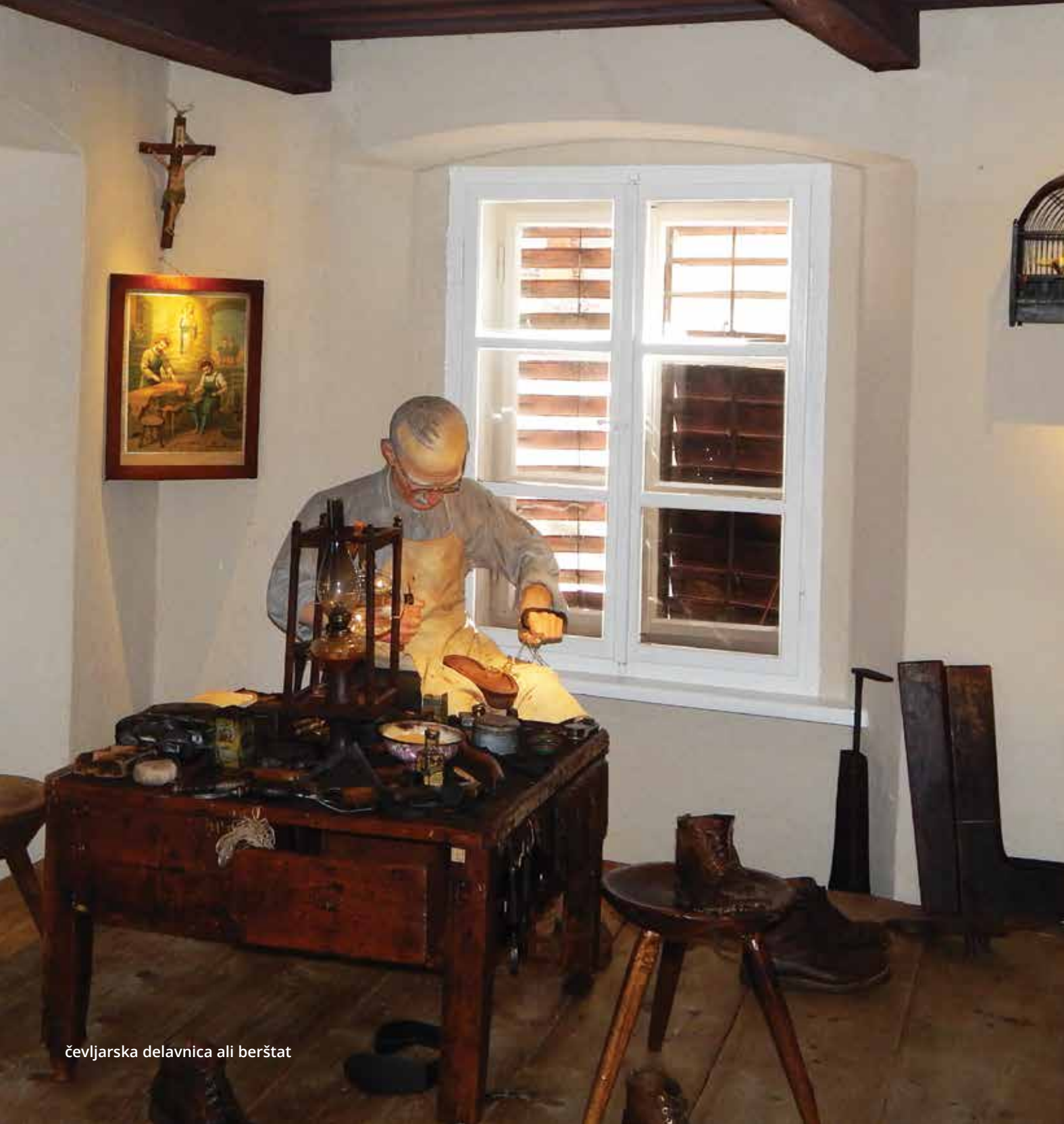
čevljarstva delavnica ali berštata

Razstava predstavlja izjemno tradicijo tržiškega čevljarstva, ki je dajalo zaslužek na tisoče Tržičanom in ponuja vpogled v staro rokodelsko izdelavo obutve in industrijsko proizvodnjo Peka ter njune rezultate, ki so se kazali v obutveni kulturi Tržičanov in drugih Slovencev.