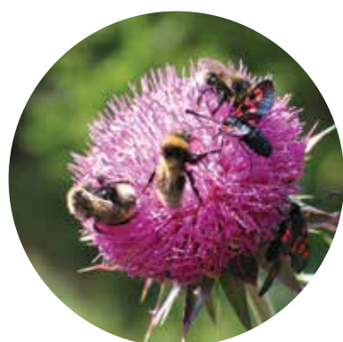
rajsko za ljudi, živali in rastline

visoke pašnike in se potapljamo v samotne gozdove pod Storžičem. Tukajšnji kultura in narava sta kot odprti knjigi. Na vprašanja o zanimivostih pa nam nevsiljivo odgovarjajo table, ki jih najdemo ob poti.