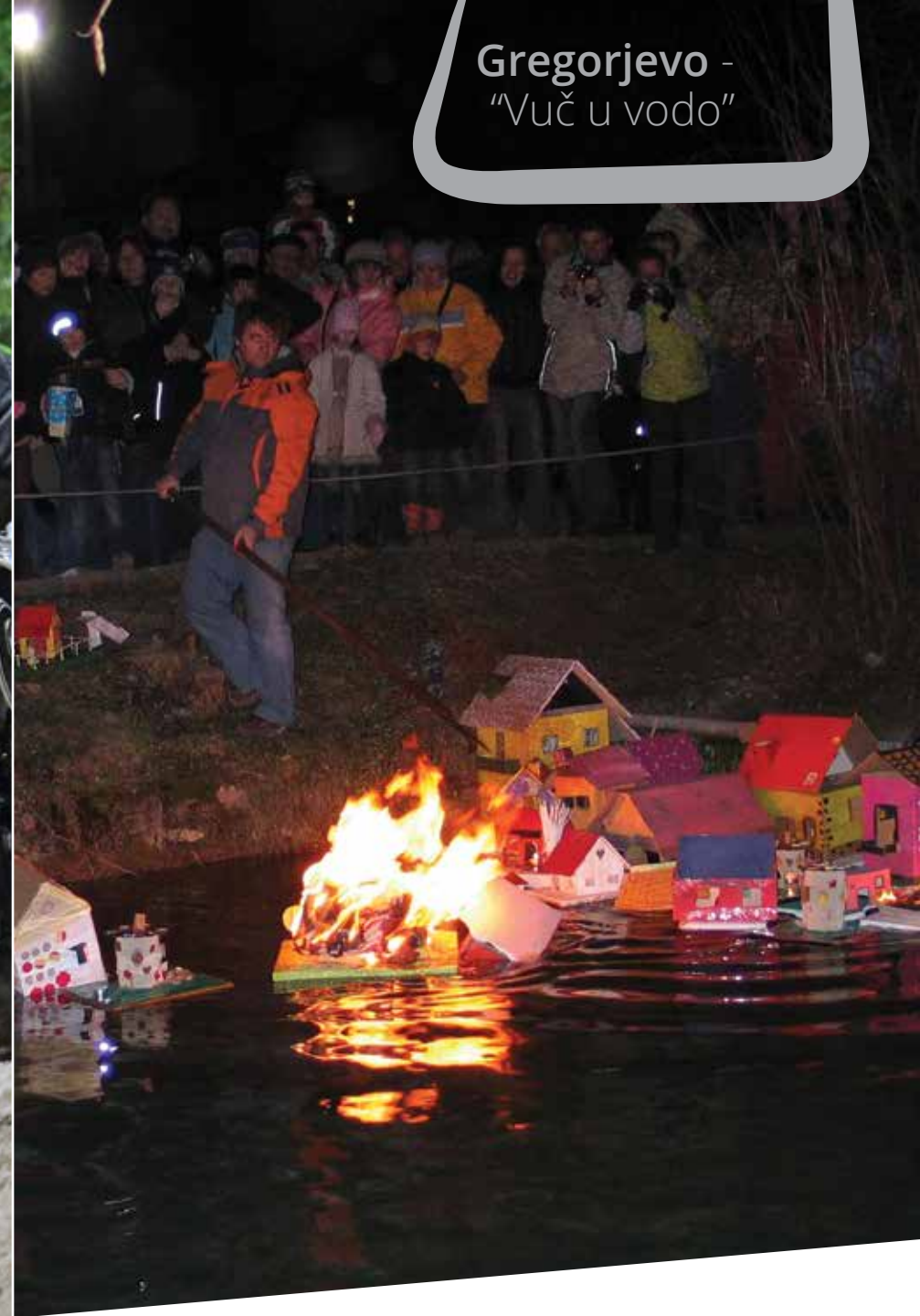
Gregorjevo - "Vuč u vodo"