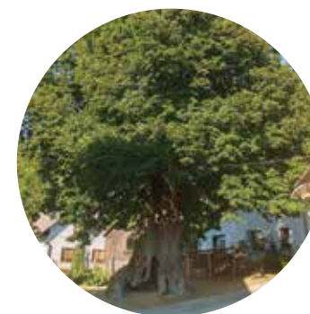
stara vaška lipa v Žiganji vasi

Nikoli ne boste vedeli, če ne preverite sami.