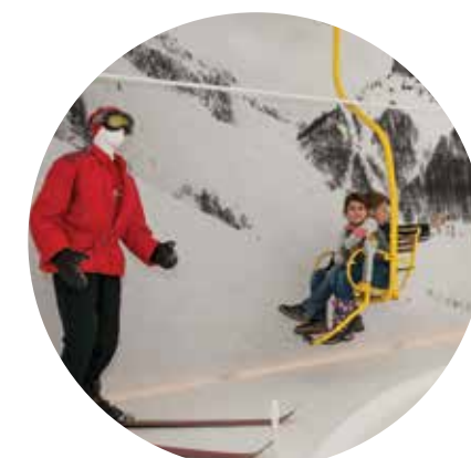
Tržič - mesto olimpijcev