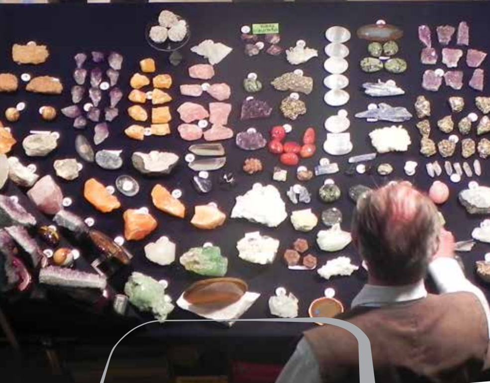
MINFOS – Mednarodni dnevi mineralov, fosilov in okolja