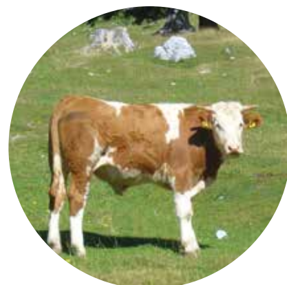
na planincih lušno biti

Začnemo na višini dobrih 1000 metrov, pod visokogorsko turistično kmetijo Pr' Tič. Tam si lahko ogledamo zbirko tesarskega orodja, stare vozove in sani, značilno ročno orodje in pripomočke za kmetovanje.