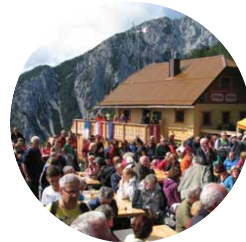
ples brez meja