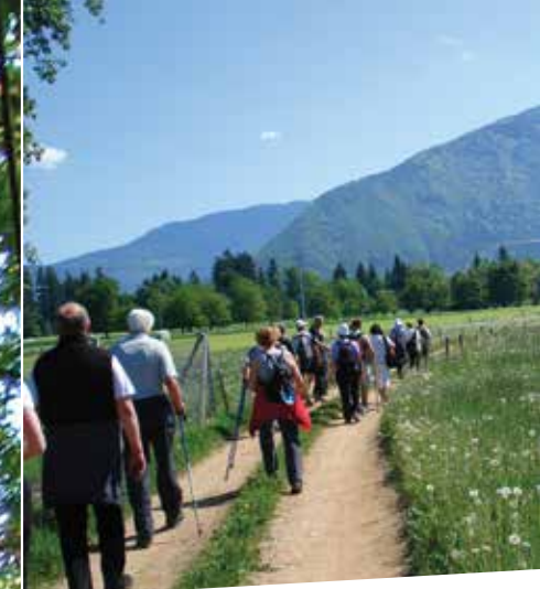
pot za skupinski izlet ...

ROMARSKA POT naravni rožni venec na svetu