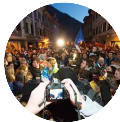
silvestrovanje na prostem