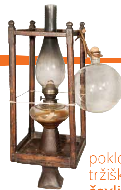
luč na gavge