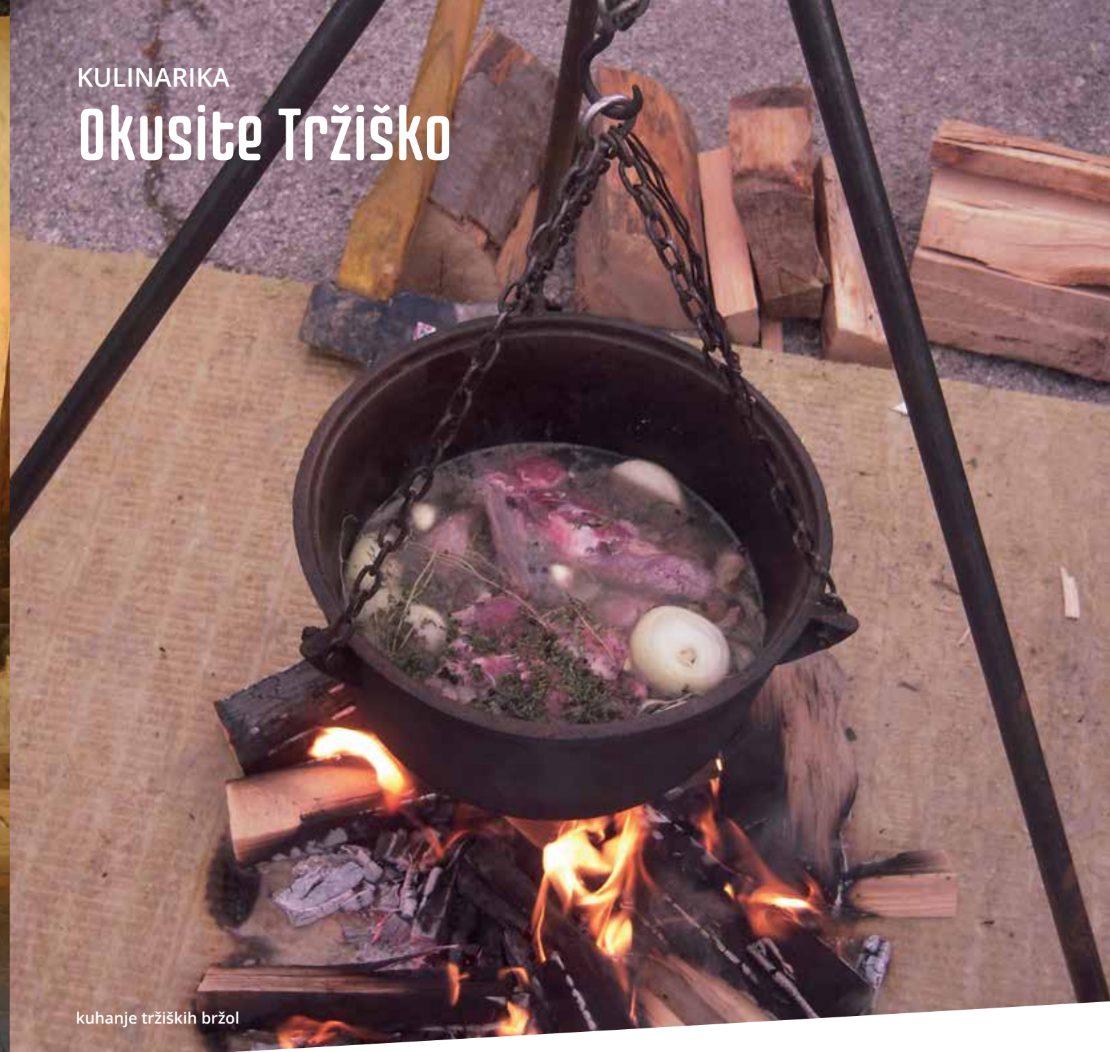
kuhanje tržiških bržol

Najbolj znana tržiška jed so zagotovo tržiške bržole, enolončnica iz ovčjega ali koštrunovega mesa, ki ji je posvečena tudi vsakoletna prireditev Festival tržiških bržol.