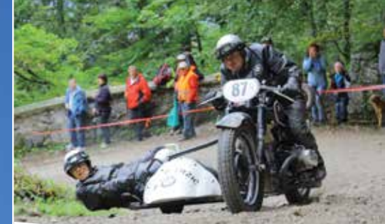
Hrastov memorial – mednarodni gorski preizkus starodobnikov