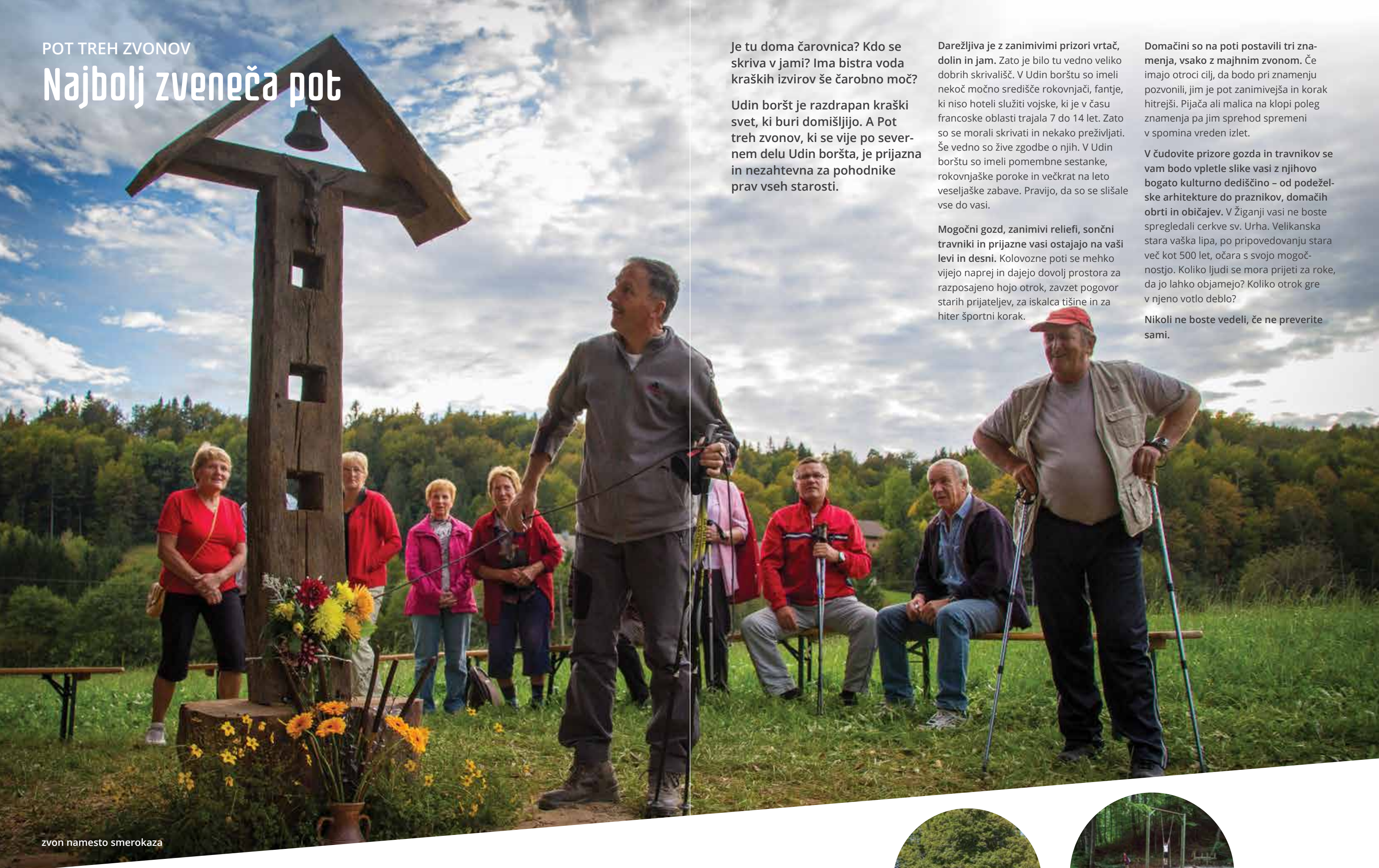
zvon namesto smerokaza

Je tu doma čarovnica? Kdo se skriva v jami? Ima bistra voda kraških izvirov še čarobno moč?