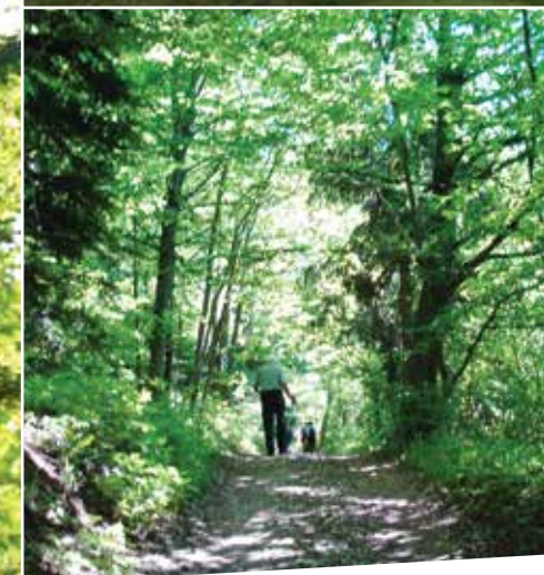
... ali samotno romanje