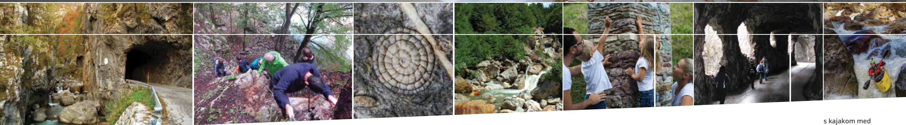
najožji del soteske in Bornov predor

Pestra kamninska sestava se odraža tudi v zelo raznoliki in bogati rastlinski sestavi, saj le malo kje na enem mestu najdemo toliko drevesnih in grmovnih vrst. Prav zato je sprehod po gozdni učni poti, na kateri je na dolžini približno 1000 metrov 6 opazovalnih točk, pravi način za spoznavanje zanimivih dejstev o gozdovih in gospodarjenju z njimi, table pa govorijo tudi o živalih, značilnostih gozdnega ekosistema na splošno in nekaterih posebnostih gozdnih površin na območju Slovenije.