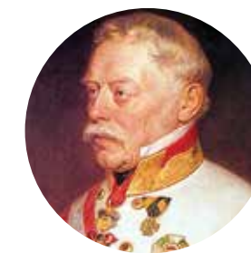
maršal Josef Radetzky