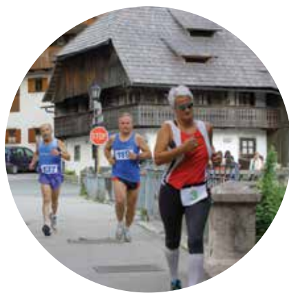
tek po ulicah Tržiča