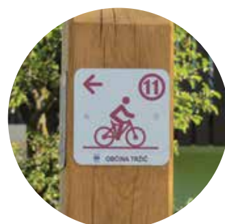
smerokaz na kolesarski poti pod Storžičem

Torej, s kom greste kolesarit na Tržiško?